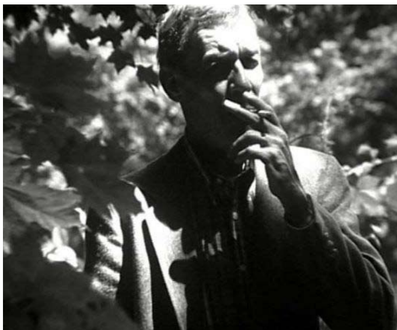
Margaret Salmon - P.S. 2002 ,Film 16mm

Saluée notamment par Gillian Wearing, l'oeuvre de cette cinéaste d'origine américaine se nourrit de références à la grande tradition réaliste du septième art, qu'il s'agisse du documentaire de propagande de la Farm Security Administration aux États-Unis, du néoréalisme italien, ou du cinéma-vérité français. À la manière des pionniers du film d'artiste, Margaret Salmon travaille seule, tournant en 16 mm ou en super 8. Ses sujets sont tirés du quotidien : personnages de condition modeste, souvent des proches, dont elle montre les vies à la fois ordinaires et dramatiques. Particulièrement sensible aux interactions entre la bande-son et l'image, Margaret Salmon en tire des effets troublants qui augmentent la sobriété documentaire de ses films d'une dimension lyrique.