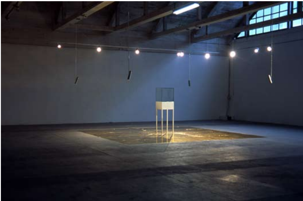
Julien Discrit-Disques d'or-Voyager live, 2005 , installation -Courtesy Galerie Martine Aboucaya -Collection Frac Champagne-Ardenne

Géographe de formation, Julien Discrit interroge la mise en image du monde à travers différents médiums. Les représentations qu'il propose sont souvent décalées, relatives, contingentes ou fragmentaires. Il supprime les repères habituels pour obliger le regardeur à faire l'expérience du doute.