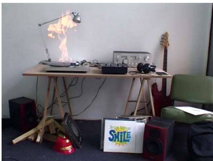
Dominique Blais - Burning Mrs O'Leary's Cow, 2006, Vidéo (DVD)