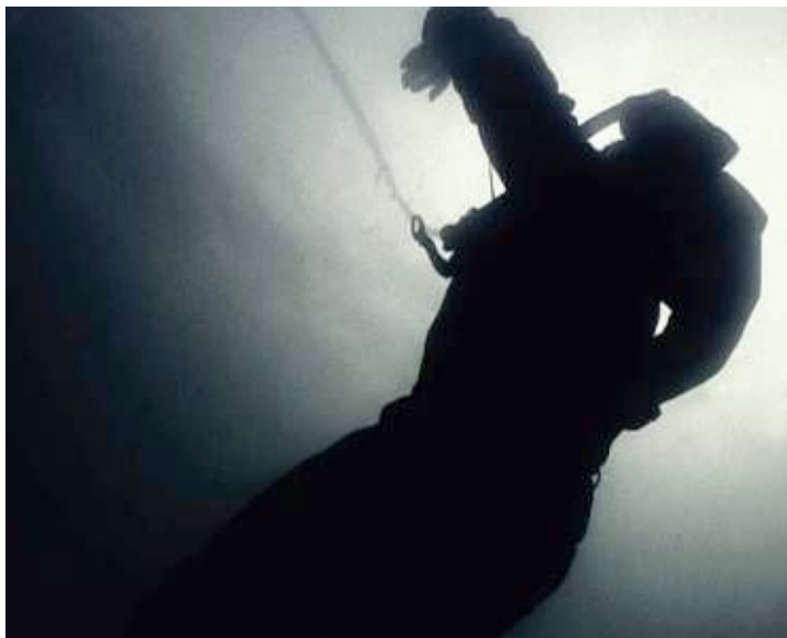
Mel O'Callaghan, "The Fall", 2004, vidéo (DVD), 4'15"

VIDEOFORMES Festival, Clermont-Ferrand (FR)