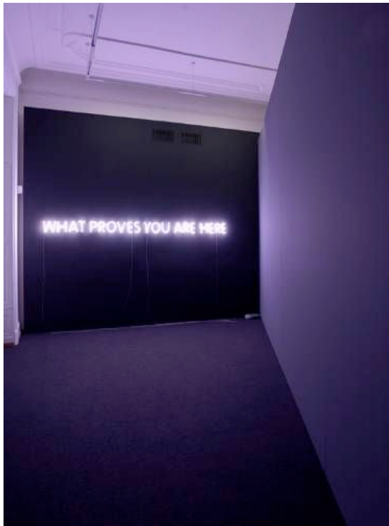
Vittorio Santoro, "What proves you are here", 2006

Ticker 9, Galerie carlier/gebauer, Berlin